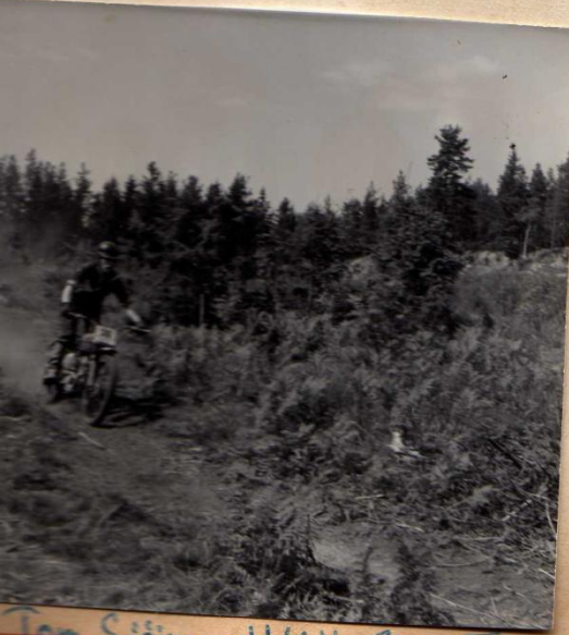
Tom Sjöman HMK 200 Triumph